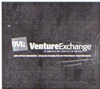
Lámina N° 2: Logotipo del Segmento de Capital de Riesgo de la Bolsa de Valores de Lima.

Reformulado aquel Reglamento en el 2005 con una norma bajo el mismo título 31 , es pues el único dispositivo jurídico peruano que se acerca a la institución del capital de riesgo, aunque se restringe sólo al ámbito bursátil y, dentro de éste, a las empresas mineras cuyas acciones están listadas en la Bolsa de Valores de Lima, no dirigiéndose tampoco a todas ellas, sino sólo a aquellas que califican como mineras junior .