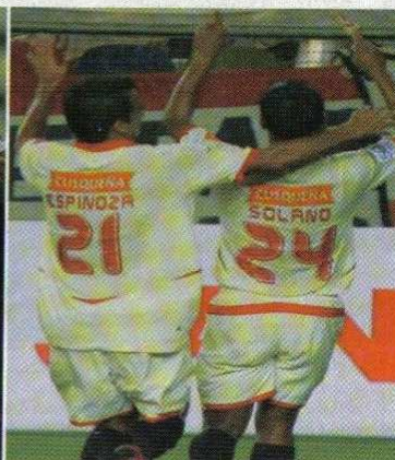
NUEVA LEY: clubes de fútbol podrán resolver sus problemas financieros.