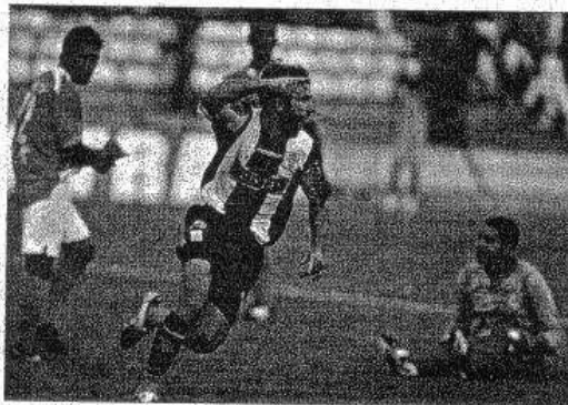
CLUBES DE FÚTBOL: se constituirán como sociedades con 200 UIT como mínimo.

El capital mínimo de constitución y funcionamiento de los clubes deportivos de fútbol profesional como sociedades anónimas abiertas está fijado en 200 UIT. La ley también establece que, además de los impedimentos previstos en la Ley General de Sociedades, no podrán integrar sus órganos de administración y gobierno las personas que estén cumpliendo condena por la comisión de un delito doloso y aquellas que hayan sido