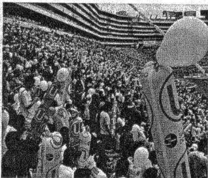
UNIVERSITARIO: no pudo exonerarse de responsabilidad.

De esta manera, la Sala llegó a la conclusión de que Universitario no acreditó la existencia de situaciones ajenas a su